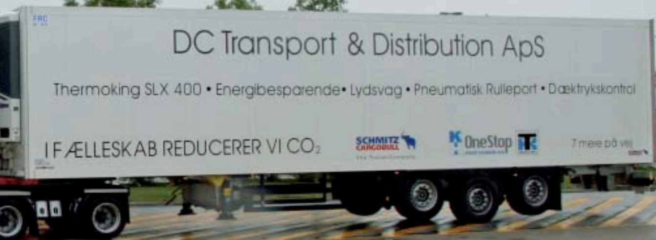
▲ Den samlede opbygning er noget af en lang svend, men til gengæld uhyre miljøvenlig.