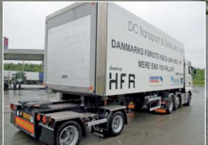
Hele processen med at få linket på plads styres fra førerhuset.