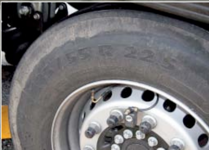
Dæktrykskontrollen sikrer, at lufttrykket i dækkene altid er korrekt – det er også med til at spare på brændstoffet.