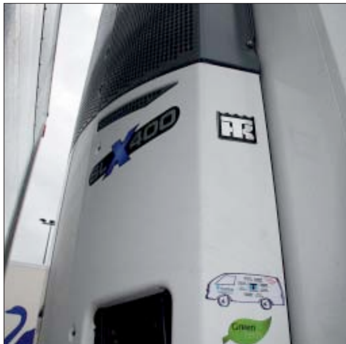
Køleanlægget er fra Thermo King.